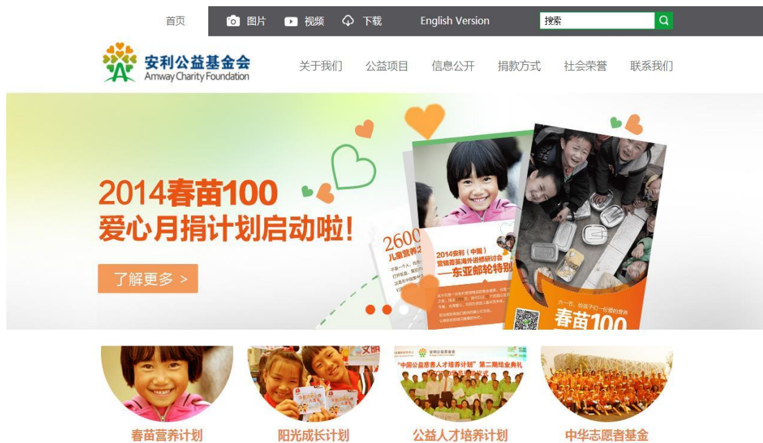
图 1 安利公益基金会官方网站主页

在 2013 年全国基金会透明指数 (FTI) 排行中, 安利公益基金会以满分 100 分的 FTI 得分与其他 105 家基金会共同位列全国基金会透明度第 1 名。而在 2012 年, 安利公益基金会的透明度得分仅为 75.56 分, 排名全国第 133 名。 2 过去一年里, 安利公益基金会通过自身的努力在信息公开方面取得了巨大的进步。