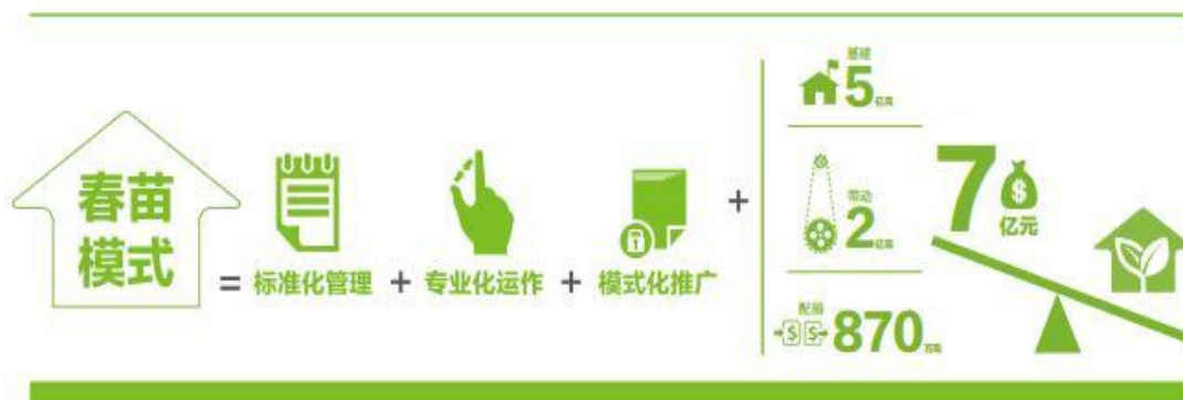
图 2 “春苗营养计划”项目示意图

立 3000 所“春苗营养厨房”和培训 3500 名厨房管理员，使得 150 万贫困儿童获益。 4